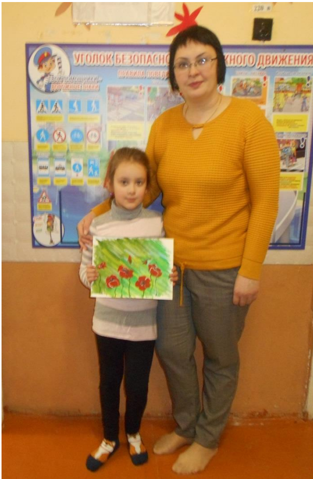
Организована выставка совместных рисунков детей и родителей «Пусть всегда будет мир!»